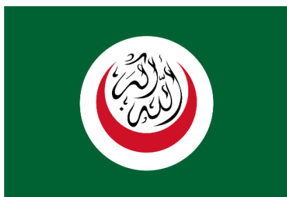
Flamuri i mëparshëm OBI-së

Figura nr.1: Flamuri i mëparshëm i OBI-së dhe stema aktuale e kësaj organizate